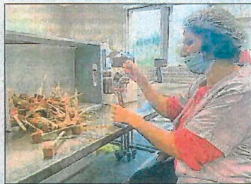
Au sein de l'Esat du Fourniller, des sucettes en chocolat sont conditionnées.

Chaque atelier est encadré par un moniteur. Il y en a une vingtaine répartie sur les deux établissements. Gislain